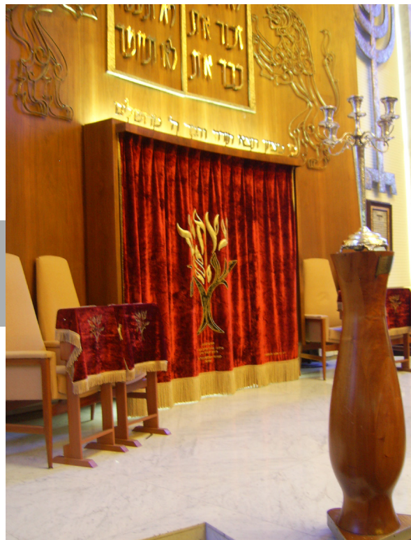
Figura 2. El armario sagrado o aaron akodesh guarda los rollos venerados de la Torá. Interior de la sinagoga Beth Itzjak (1964-67) del ingeniero civil Boris Albin Subkis, localizada en Ignacio Sue núm. 20, esquina Luis G. Urbina, colonia Polanco, delegación Miguel Hidalgo, Ciudad de México.

Así ocurre en las iglesias católicas apostólicas cuando la hostia es expuesta dentro de un cáliz para la adoración de la feligresía, o también, cuando ciertas imágenes pictóricas o escultóricas adquieren una connotación sagrada por haber aparecido milagrosamente. Por su parte, la veneración ocurre hacia los rollos de la Torá que se resguardan celosamente dentro de los aaron akodesh(13) al interior de las sinagogas, los cuales si bien no son idolatrados, son venerados por contener la palabra sagrada, además de que en ocasiones son antiquísimos pues han sido transferidos de generación en generación entre los miembros de la comunidad judía internacional [Figura 2].