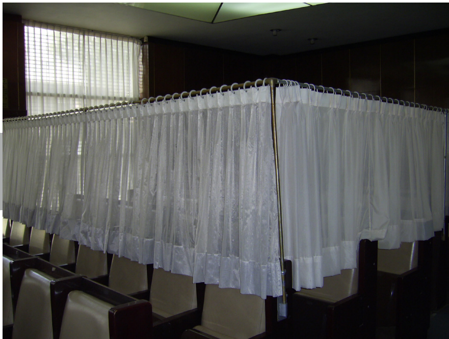
Figura 11. Cortinilla que indica el área reservada a las mujeres dentro de la nave principal de una sinagoga. Interior de la sinagoga Agudat Ajim (1959-60) del ingeniero civil Abraham M. Chelminsky, en Francisco Montes de Oca núm. 32, esquina con Parral, colonia Condesa, delegación Cuauhtémoc, Ciudad de México.

4. Creencias morales. Todas las concepciones religiosas conllevan una perspectiva sobre el comportamiento moral de los individuos que integran la comunidad de fieles, aplicables tanto para quienes detentan un papel eclesial, como para los beneficiarios espirituales, independientemente de que logren o no cumplirlo esos preceptos morales. (28) Estos criterios morales –que fundamentan tanto en los libros sagrados como en las tradiciones orales– indican aquellos pensamientos y comportamientos que son considerados como “buenos” o “malos”, así como también las consecuencias que su cumplimiento o transgresión conlleva en el cuerpo y en el espíritu, es decir, en la vida presente y en la que pervivirá después de la muerte física.