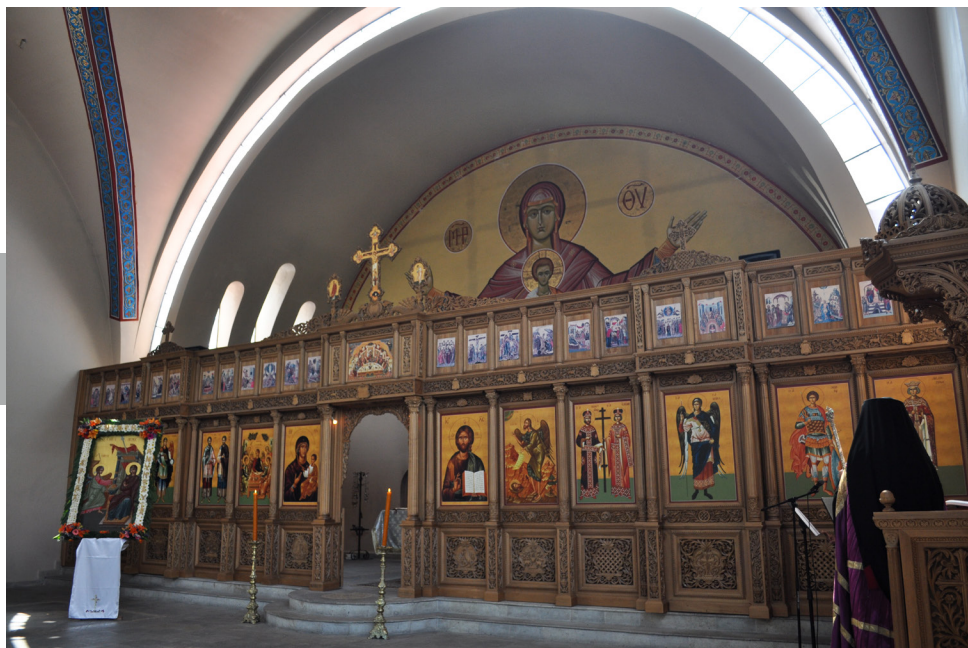
Figura 12. El iconostasio es un cancel con imágenes que separa el sagrado altar del espacio de la nave dentro de las iglesias católicas ortodoxas. Interior de la Catedral Ortodoxa Griega de Santa Sofía (1965-72) de los arquitectos Guillermo Rossell de la Lama y Manuel Larrosa, localizada en Agua Caliente esquina con Saratoga, colonia Lomas Hipódromo, Naucalpan, Estado de México.

Desde luego, siempre han existido producciones artísticas sin una finalidad religiosa, sin embargo, cuando sí la tienen –como en el género arquitectónico que nos ocupa– el artista no es completamente libre, pues su creatividad se encuentra acotada –y en muchos casos normada, vigilada y censurada– por las exigencias teológicas, eclesiales, litúrgicas y morales que cada religión impone, sólo transformables con el paso de los tiempos desde las propias instituciones eclesiales. Por ejemplo las iglesias católicas apostólicas son ricas en la incorporación de muchas disciplinas artísticas, pues la utilización de imágenes es perfectamente aceptada, por lo cual, aparecen figuras antropomórficas, zoomórficas y fitomórficas con finalidades simbólicas, estéticas y didácticas, lo mismo en pintura, escultura, mosaicos o hermosos vitrales. También la Iglesia Católica Ortodoxa suele tener gran devoción por la adoración de imágenes o íconos, una tradición que proviene de tiempos medievales. Hoy en día, basta visitar cualquier templo ortodoxo en Grecia o Turquía para percatarse de la importancia de las imágenes en la devoción de los fieles, a tal punto en que suelen besar el cristal que las protege, luego de prender una pequeña vela frente a ellas [Figura 12].