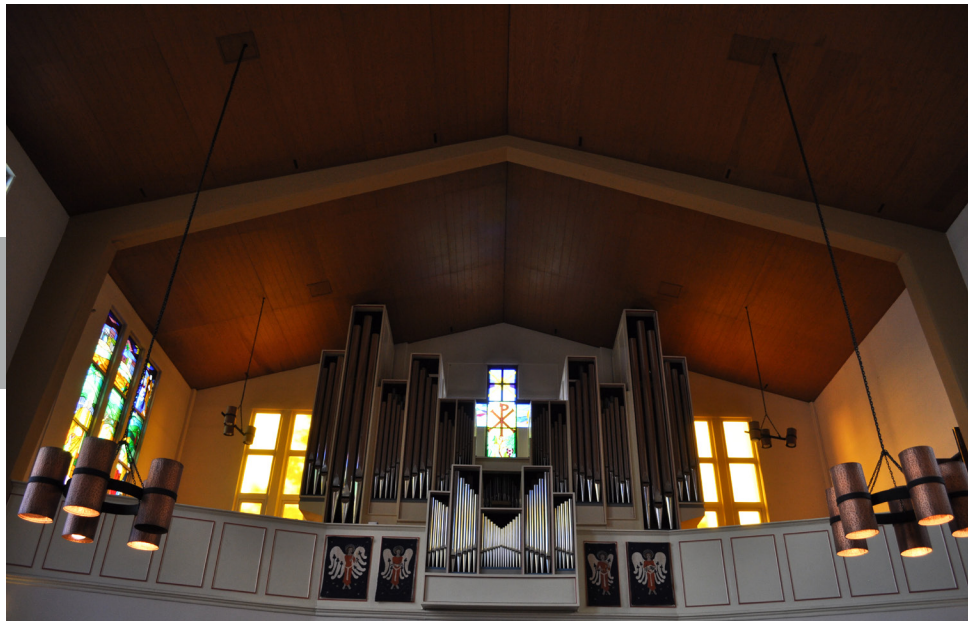
Figura 5. Órgano en el coro superior de la Iglesia Evangélica Luterana de Habla Alemana (1958), en Botticelli núm. 74, la colonia Mixcoac, delegación Benito Juárez, Ciudad de México.

para celebraciones protestantes, cuya letra es cantada por los propios feligreses, pues consideran que el canto es un elemento imprescindible dentro del propio proceso de adoración; por esta importancia, los templos protestantes suelen aprovisionarse adecuadamente de numerosos libros de himnarios dispuestos entre las bancas, así como poseer suficiente luz natural para el seguimiento de las estrofas y una estratégica ubicación de los órganos o demás instrumentos musicales [Figura 5].