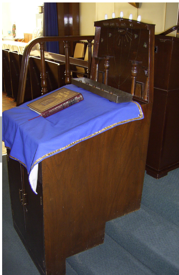
Figura 8. Las concepciones cosmogónicas provienen de los libros sagrados para cada religión, como ocurre con la Torá y el Talmud para los judíos. Libro sobre el púlpito o bimá de la sinagoga Agudat Ajim (1959-60) del ingeniero civil Abraham M. Chelminsky, localizada en Francisco Montes de Oca núm. 32, esquina con Parral, colonia Condesa, delegación Cuauhtémoc, Ciudad de México.

las posibles explicaciones acerca de la inexorable muerte física de los seres humanos. Como es sabido, todas las religiones intentan brindar sus propias respuestas frente a esas inquietantes interrogantes, a veces apoyándose en libros o documentos fundacionales, y en otras, en mera tradición oral, como ocurría en las religiones más antiguas. Las tres grandes religiones monoteístas poseen sus propios libros principales –Torá, Biblia y Corán– los cuales son considerados como sagrados por los propios feligreses al ser portadores de la palabra divina y trascendente [Figura 8].