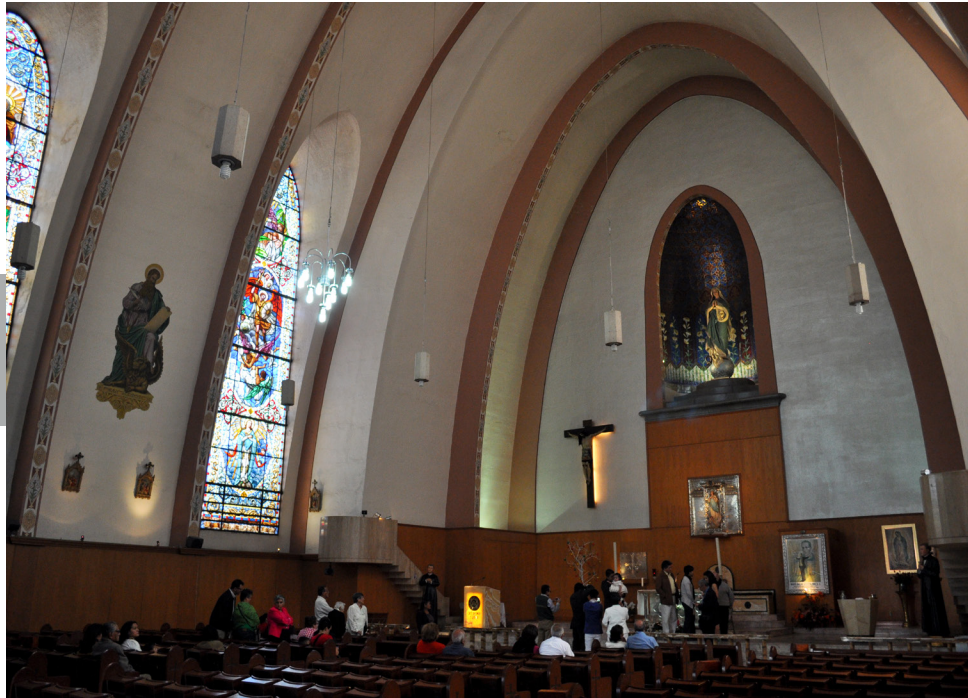
Figura 16. La tipología estructural de esta capilla fue una bóveda apuntada de medio cañón, mientras que su tipología constructiva no fue de concreto armado como podría suponerse, sino con el tradicional ladrillo unido con mampostería. Interior y exterior de la capilla de la Inmaculada Concepción (1942) del arquitecto José Creixell del Moral (anexa a la parroquia de la Sagrada Familia), localizada en Puebla núm. 148, colonia Roma, Ciudad de México.

cuando a causa del desmembramiento del Imperio Romano de Occidente se interrumpió la fabricación imperial del cemento o puzolana, material indispensable para la realización de los núcleos de concreto u hormigón –sin armar, desde luego– por lo que las posteriores construcciones medievales dejaron de incorporar esa tipología constructiva, y debieron entonces implementar otras soluciones constructivas–como los muros de sillares reforzados con contrafuertes– que les permitieron enfrentar los nuevos retos espaciales, justo por no contar ya con aquella tecnología extinta.