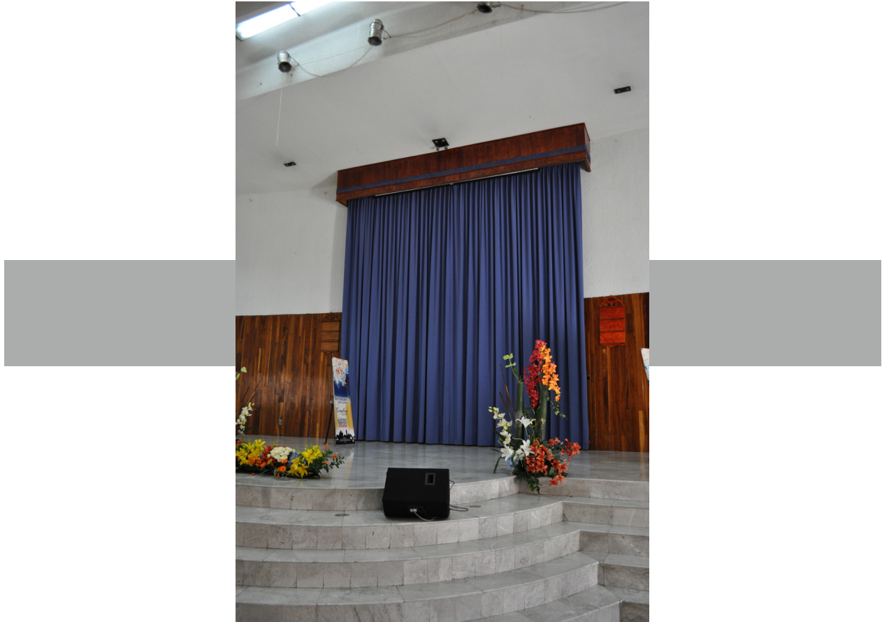
Figura 7. Cortina que resguarda la tina bautismal localizada al frente, para que la feligresía atestigüe la validez pública del sacramento. Interior del Templo Adventista del Séptimo Día, localizada en Sadi Carnot núm. 12, colonia San Rafael, delegación Cuauhtémoc, Ciudad de México.

que pueden considerar sólo una, o dos o los cinco conceptos de sacralidad de manera simultánea. Por ejemplo, las iglesias del catolicismo apostólico y las del ortodoxo suelen utilizar las cinco estrategias de la sacralidad espacial: consagran sus espacios, poseen objetos sagrados, efectúan siempre los mismos rituales litúrgicos, cantan o escuchan la palabra de Dios y estiman a la asamblea reunida como manifestación misma de la sacralidad. En el polo opuesto, los testigos de Jehová y los cristianos sólo estiman dos elementos sagrados, la palabra bíblica y la feligresía reunida, mientras que a las tres restantes no le conceden validez alguna.