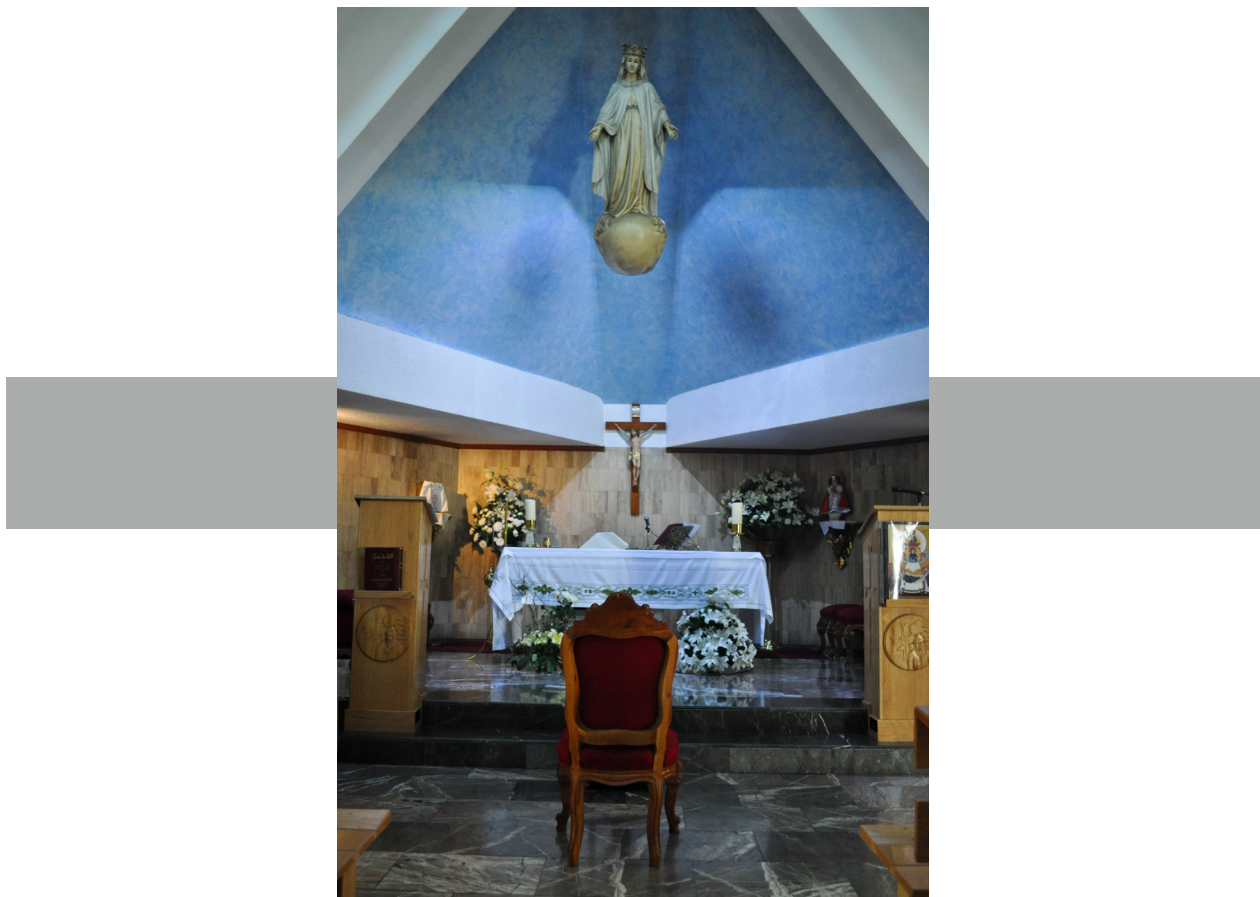
Figura 6. El rito maronita es uno de los ritos aprobados oficialmente por la Iglesia Católica Apostólica. Interior del templo de Nuestra Señora de Libano (1969-1972), localizado en Manzano núm. 29, colonia Florida, delegación Álvaro Obregón, Ciudad de México.

Esta asamblea reunida es indispensable para atestiguar el cumplimiento de los sacramentos más importantes de las Iglesias, como por ejemplo, el bautismo de un infante o de un adulto, que solo alcanza validez sagrada cuando es llevado a cabo frente a la congregación, como ocurre con los testigos de Jehová, los adventistas del séptimo día,(22) los mormones, los evangélicos de la iglesia bautista o los cristianos de la Luz del Mundo,(23) por lo que sus espacios de culto suelen disponer de pilas o espaciosas albercas situadas visual y jerárquicamente para que la asamblea reunida confirme la ceremonia, en la que pueden realizarse uno o varios bautizos colectivos [Figura 7]. En algunas iglesias, como la judaica, es necesario una asamblea con ciertas características para celebrar el rezo, pues se debe contar con un minián, el quórum de por lo menos diez hombres mayores de trece años, la edad biológica en los varones que se considera paso a la adultez sexual, religiosa y moral. Se trata así de un concepto de asamblea sagrada que no requiere de un espacio consagrado, pues les permite efectuar el rezo en cualquier lugar permanente o efímero, ya sea una tienda en el desierto o la cubierta de un barco –siempre y cuando se cuente con un minián– pues se trata de comunidades que están impuestas históricamente a la movilidad y migración.