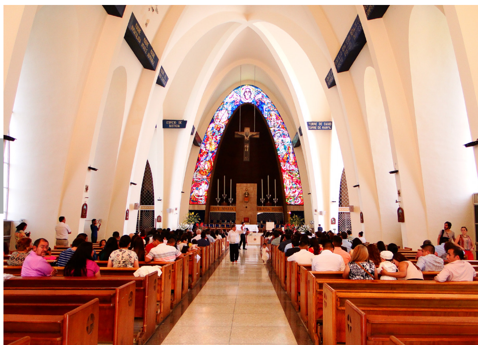
Figura 15. La tipología estructural de este templo fue una bóveda apuntada de medio cañón, mientras que su tipología constructiva fue una cubierta de concreto armado reforzada con nervios fajones. Interior de la Basílica de la Purísima Concepción de María (1941-43), del arquitecto Enrique de la Mora y Palomar, en Monterrey, Nuevo León.

3. Tipología constructiva. Relacionado con el punto anterior se encuentran las soluciones constructivas, que constituyen un nivel más en las decisiones proyectuales del autor de los templos, o de cualquier género arquitectónico inclusive. Pueden aparecer desde soluciones singulares y utilizadas por una sola vez, hasta las que por su alta eficiencia son repetidas intensamente en un determinado tiempo y lugar, conformándose así en una tipología constructiva, la cual combina ciertos materiales y procedimientos específicos. A diferencia del reducido número de tipologías estructurales, la constructiva es extremadamente extensa, pues depende de la tecnología edificatoria que cada cultura y época disponga. Así por ejemplo, un albañil tradicional probablemente dominará ciertas tipologías constructivas de su región, como los muros de adobe si vive en zonas templadas, pero tal vez no sepa realizar muros de bajareque propio de las regiones tropicales, sin embargo, probablemente ambos dominen la común tipología constructiva de muros de ladrillo reforzados con castillos de concreto armado. Otro aspecto importante que distingue a la tipología constructiva de aquella estructural es que la primera incorpora tanto elementos divisorios como los que soportan una responsabilidad tectónica, mientras que los elementos estructurales están siempre comprometidos con la transmisión de las cargas que preservan la estabilidad física del edificio [Figuras 15 y 16].